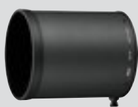
Gegenlichtblende HK-34 (Im Lieferumfang enthalten)