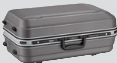
Objektivkoffer CT-505 (Im Lieferumfang enthalten)